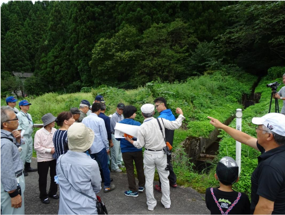
2016年9月17日に山形県庄内町木の沢地区で実施したまちあるき

す。図上検討会（DIG）でも住民から様々な意見が出され、地域の一体感を感じました。なお、検討会終了後に、地元の皆さんから今年取れたれの新そばをふるまってくれました。大変美味しかったです。マップについては「作って終わり」ではなく、地域の安全・安心のために永続的に使ってもらえるようにすることが重要です。日本で初めての取り組みはNHK山形放送や山形新聞にも大きく取り上げられました。こうした取り組みが全国的にひろがると良いと思っています。