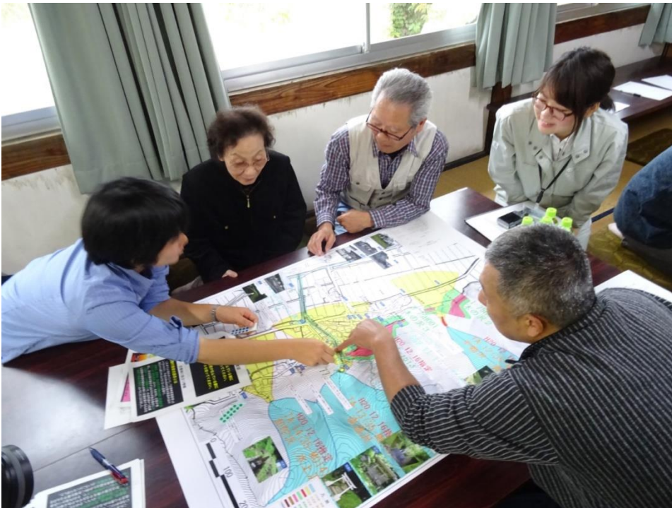
2016年10月23日に山形県庄内町木の沢地区で実施した図上検討会（DIG）